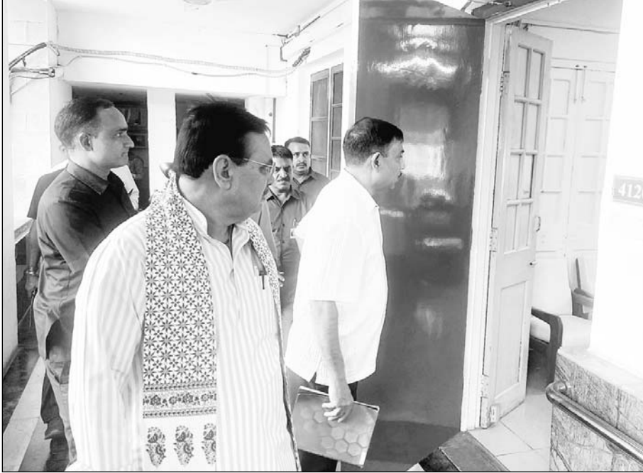
मुख्यमंत्री भजनलाल शर्मा ने मंगलवार को सुबह अचानक सचिवालय की मुख्य बिल्डिंग में निरीक्षण करने के लिए पहुंच गए। इस दौरान सी.एम.ने सचिवालय के मुख्य भवन में करीब 10 मिनट बिताए।