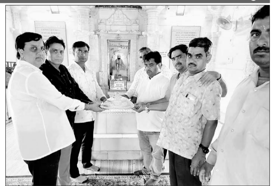
श्रद्धालुओं ने अमरपुरा स्थित समाधि स्थल पर एक किलो से अधिक चांदी का छत्र समर्पित किया।