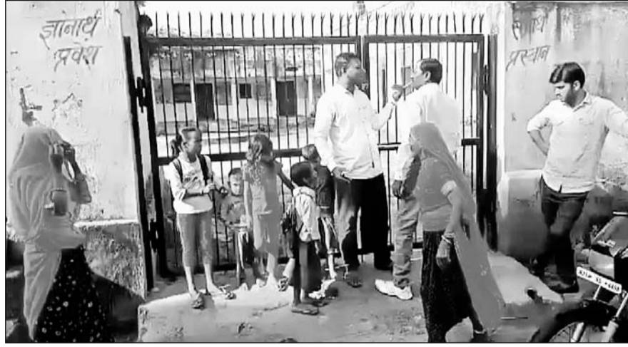
चाकसू उपखंड के खेडा जगन्नाथपुर में ग्रामीणों ने स्कूल के मेन गेट पर ताला जड़ प्रदर्शन किया।

मामला उपखंड क्षेत्र के अंतर्गत कोटखावदा तहसील की ग्राम पंचायत बड़ोदिया के ग्राम खेडा जगन्नाथपुरा स्थित उच्च प्राथमिक विद्यालय का है जहां समय पर शिक्षकों के विद्यालय में नहीं आने एवं पास के कुएं में खाली शराब की बोतलें मिलने से गुस्सा ग्रामीणों ने स्कूल के मेन गेट पर ताला जड़ दिया तथा धरना प्रदर्शन करने लगे। इसके साथ ही स्कूल में बच्चों के साथ अध्यापकों को भी अंदर नहीं जाने दिया। इस पर शिक्षकों ने ग्रामीणों को विश्वास दिलाया कि वह अब समय से स्कूल में आएंगे तब जाकर ग्रामीणों ने ताला खोला। ग्रामीणों का आरोप है कि विद्यालय के शिक्षक समय पर नहीं आते हैं इस पर उन्होंने