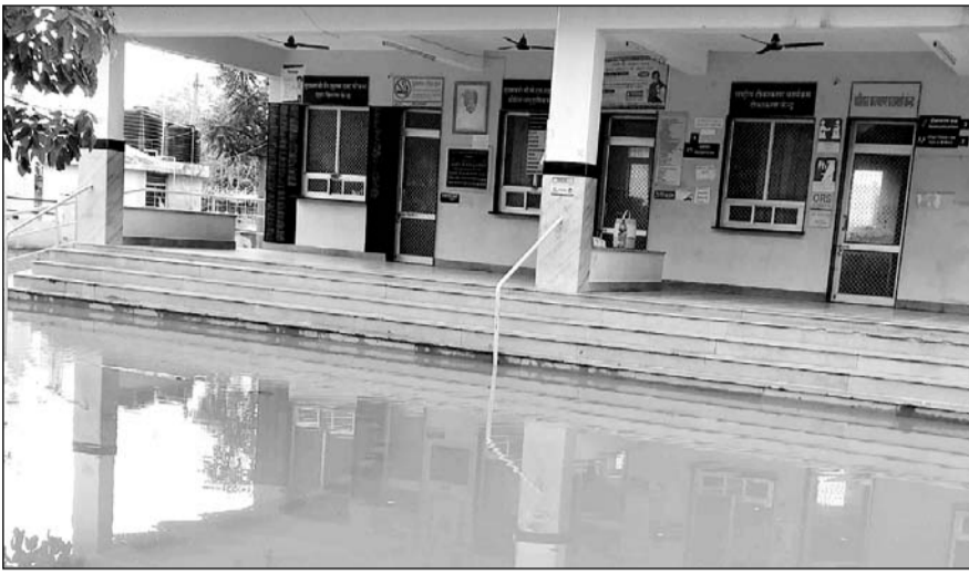
बीदासर कस्बे में रविवार की सुबह 11 बजे बाद लगभग एक घण्टे तक जमकर बरसात हुई जिससे चारों ओर पानी ही पानी हो गया।

बीदासर, (निसं)। कस्बे में रविवार की सुबह 11 बजे बाद लगभग एक घण्टे तक जमकर बरसात हुई जिससे चारों ओर पानी ही पानी हो गया तथा कस्बे के मुख्य मार्ग पर बरसाती पानी ने दरिया का रूप ले लिया। कस्बे के मुख्य मार्ग पानी से लबालब हो गया। इससे पूर्व रविवार की सुबह करीब 6:00 बजे अचानक मौसम ने करवट ली और आसमान बादलों से अट गया तथा रिमझिम बरसात का दौर शुरू हो गया। जिसके बाद लगभग साढ़े बजे आधे घण्टे तक अच्छी बरसात हुई। वहीं सुबह 11 बजे से पुनः झमाझम बरसात का दौर शुरू हो गया। बरसात के चलते कस्बे की विद्युत आपूर्ति टप हो गई जो 1 बजे के बाद बहाल हुई। बरसात के चलते कस्बे के राजकीय सामुदायिक स्वास्थ्य केन्द्र परिसर, मण्डी बाजार, गणगोरी चौक, बैंक ऑफ बड़ौदा रोड, वाल्मिकी बस्ती, शिव कॉलोनी, नगर पालिका मार्ग पर स्थित दुकानों व घरों में पानी भर गया। जिससे लोगों को बरसाती पानी निकालने के लिये काफी