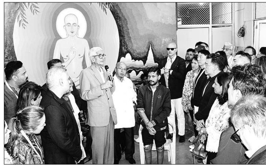
विश्वव्यापी संस्था यंग प्रेसिडेन्ट्स ऑर्गनाइजेशन के 70 सदस्यीय एक दल में जिसमें विभिन्न देशों के प्रतिनिधि शामिल थे, विश्व प्रसिद्ध जयपुर फुट की निर्माण विधि का अवलोकन किया।