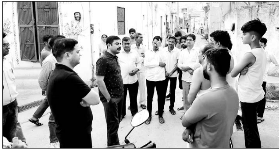
जिला कलेक्टर ने जिले के विभिन्न क्षेत्रों का दौरा किया।

इसके लिए जिला कलेक्टर नियमित रूप से जिले के विभिन्न क्षेत्रों का दौरा कर पेयजल आपूर्ति की जांच कर रहे हैं। इसी के तहत जिला कलेक्टर गुरुवार को सुबह 6 बजे खरवा एवं झांक गांव पहुंचकर पेयजल आपूर्ति के संबंध में निरीक्षण किया। उन्होंने खरवा में घाटी मोहल्ला सहित विभिन्न स्थानों पर जाकर घरों में नल द्वारा पेयजल आपूर्ति में उचित प्रेशर, नियमित अंतराल में