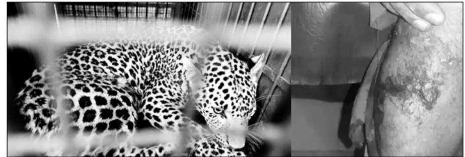
वन विभाग की टीम ने मौके पर पहुंचकर पैंथर को पींजरे में कैद किया।

हिम्मत से बची जान, लोगों के सहयोग से पैंथर को रस्सों से बांधा