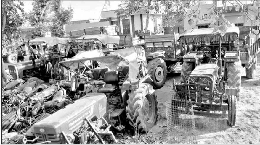
दत्तवास पुलिस ने चेजा पत्थर से भरी ट्रैक्टर-ट्रॉलियां जब्त की।