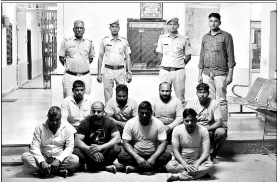
प्रताप नगर थाना पुलिस ने मामले का 24 घंटे में खुलासा कर आठ आरोपियों को गिरफ्तार किया।

कार में सवार सात-आठ व्यक्तियों ने बाइक सवार पर हमला किया था