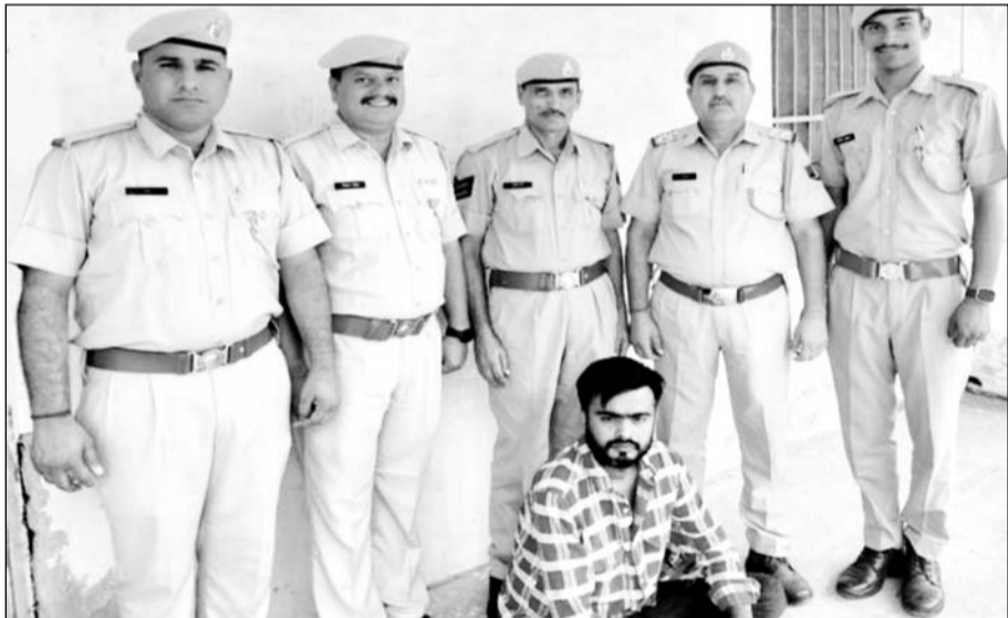
जालोर जिले में बिशनगढ पुलिस ने स्मैक बरामद कर आरोपी को गिरफ्तार किया।