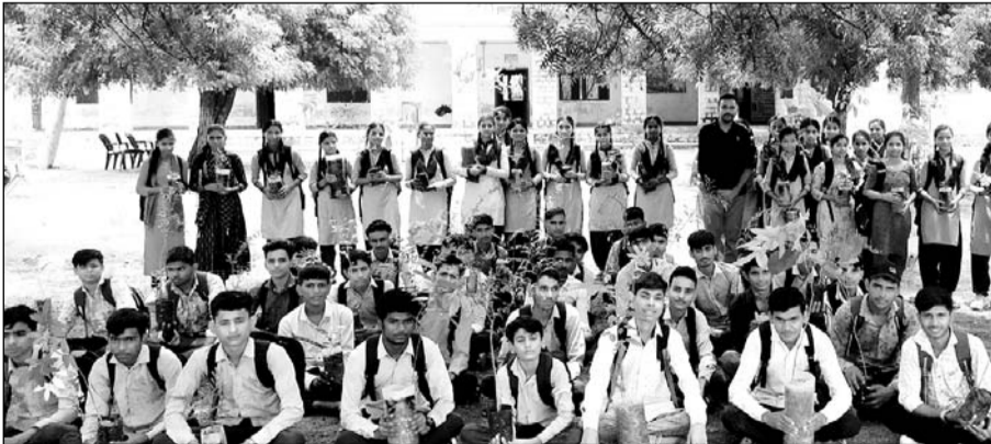
जालोर के पास राजकीय उच्च माध्यमिक विद्यालय रामसीन में एक पेड़ मां के नाम अभियान के तहत पौधारोपण किया।