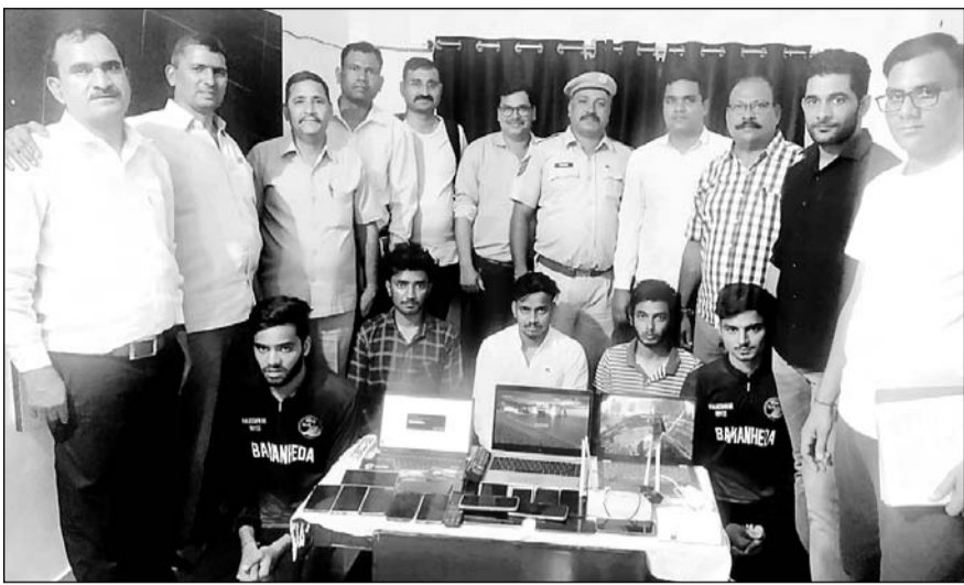
राजसमंद में पुलिस ने क्रिकेट पर ऑनलाईन सट्टा लगाने के आरोपियों को गिरफ्तार किया।