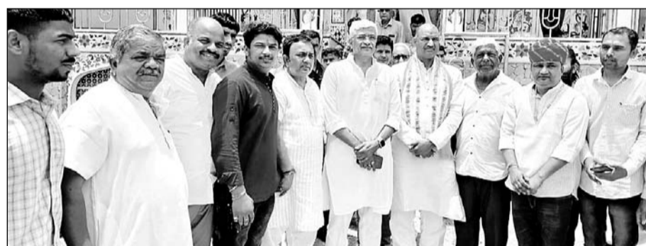
भाजपा प्रदेशाध्यक्ष सी पी जोशी, केंद्रीय जल शक्ति मंत्री गजेंद्र सिंह शेखावत का कार्यक्रमों में स्वागत एवं अभिनंदन किया।