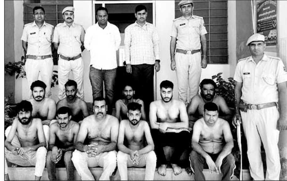
मुक्ताप्रसाद थाना पुलिस ने 13 जनों को पकड़ा।

नौ असामाजिक तत्वों के खिलाफ भी कार्रवाई की, दो वांछित भी गिरफ्तार