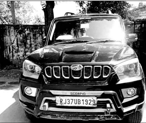
पुलिस द्वारा जब्त की गई गाड़ी।