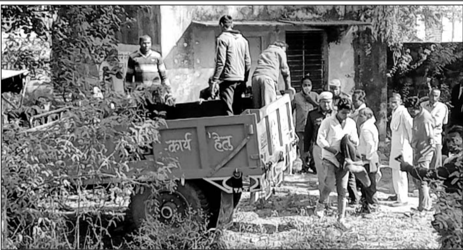
मृतक का सीएचसी पर पोस्टमार्टम कराती पुलिस।