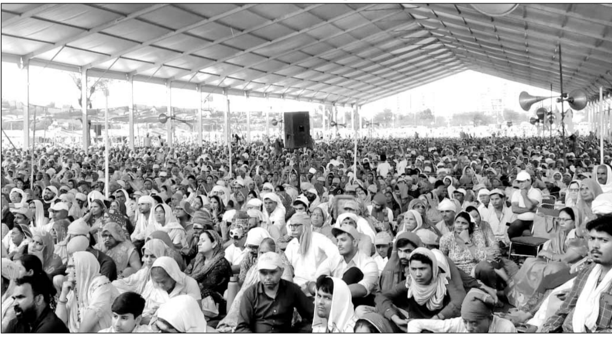
जयपुर के ठीकरी स्थित जयगुरुदेव आश्रम में चल रहे गुरु पूर्णिमा के आध्यात्मिक समागम में देश-विदेश से भक्तों का जन सैलाब उमड़ा।