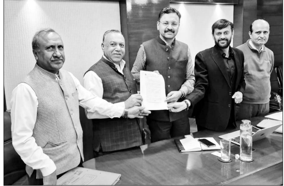
न्यू ट्रांसपोर्ट नगर सीकर रोड योजना को लेकर जयपुर ट्रांसपोर्ट ऑपरेटर्स एसोसिएशन के पदाधिकारियों ने यूडीएच सचिव वैभव गालरिया से मुलाकात की।

यूडीएच सचिव वैभव गालरिया से मिले प्रतिनिधि