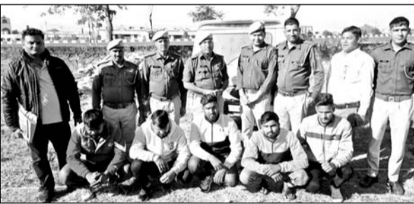
पुलिस ने हमला करने के आरोपियों को गिरफ्तार किया।