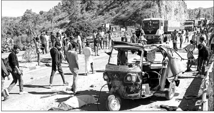
पिण्डवाड़ा हाईवे पर हुये हादसे के बाद मौके पर लोगों की भीड़ लग गई।

गोगुन्दा-पिण्डवाड़ा हाईवे पर सड़क पर हुआ हादसा, ऑटो चालक सहित नौ जने घायल