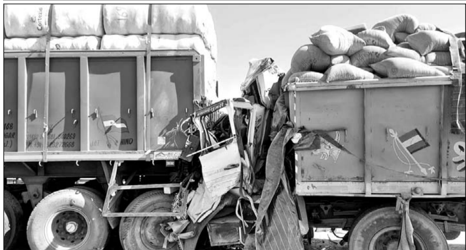
अजमेर-भीलवाड़ा हाईवे पर स्थित कोठारी नदी की पुलिया पर घने कोहरे से कई वाहन टकरा गए, इनमें एक यात्री बस भी शामिल है।

अजमेर-भीलवाड़ा हाईवे पर स्थित कोठारी नदी की पुलिया पर हादसा हुआ