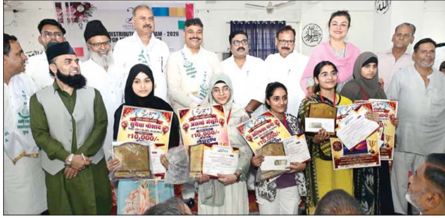
नेता प्रतिपक्ष टीकाराम जूली ने समारोह में आरएएस में चयनित अभ्यर्थियों, दसवीं और बारहवीं कक्षा में 85 प्रतिशत से अधिक अंक प्राप्त करने वाले विद्यार्थियों को सम्मानित किया।

जयपुर। नेता प्रतिपक्ष टीकाराम जूली ने कहा कि मुस्लिम समाज की मेधावी प्रतिभाओं को प्रोत्साहित करने के लिए मुस्लिम प्रतिभा सम्मान समारोह एक विशेष मंच है। उन्होंने कहा कि ऐसे आयोजनों से न केवल प्रतिभाओं को सम्मान मिलता है, बल्कि अन्य युवाओं को