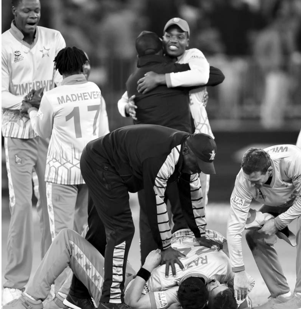
ज़िम्बाब्वे ने ग्रुप-2 के मैच में टॉस जीतकर बल्लेबाजी चुनी और पावरप्ले में दो विकेट के नुकसान पर 47 रन जोड़ लिये। ज़िम्बाब्वे एक अच्छी शुरुआत के दम पर बड़े स्कोर की तरफ अग्रसर थी लेकिन शादाब ने मध्य ओवरों में विकेट

बाबर आजम की टीम को आखिरी ओवर में 11 रन की दरकार थी और मोहम्मद नवाज़ विकेट पर मौजूद थे। नवाज़ ने पहली गेंद पर तीन रन लिये लेकिन जब पाकिस्तान को दो गेंदों में तीन रन चाहिए थे, तब नवाज़ आउट हो गये। शाहीन शाह अफरीदी ने आखिरी गेंद दो रन लेकर मैच को टाई करवाना चाहा लेकिन रेंजिस चक्राव्वा ने उन्हें रनआउट कर दिया और ज़िम्बाब्वे ने यह मैच मात्र एक रन से जीत लिया।