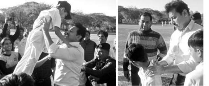
हो पाती है। इसलिए पूरे ग्राउंड में फ्लड लाइट लगाई जायेगी ताकि रात में भी खिलाड़ी प्रैक्टिस कर सकें। दूसरा राजस्थान में गर्मी ज्यादा पड़ती है और धूप में भी प्रैक्टिस नहीं हो पाती है। एकेडमी में लड़के और लड़कियां खेलती हैं और अब बारिश का मौसम आने वाला है। इससे बचने के लिए इंडोर स्टेडियम में पांच लेन की क्रिकेट प्रैक्टिस की व्यवस्था करवाई जायेगी। जहां बोलिंग मशीन भी मंगावाई जायेगी। राजस्थान के हित और खिलाडियों को कोई भी नुकसान न हो, खिलाडियों को खेलने के अवसर मिले इसके लिए जो भी प्रशासनिक कदम उठाने हैं स्पोट्स कॉंसिल उठाएगी।