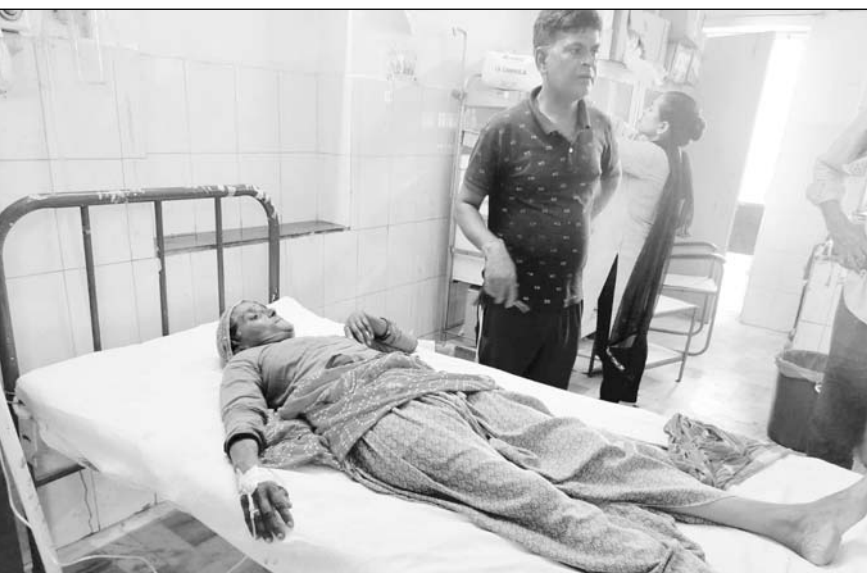
महिला को प्राथमिक उपचार के बाद जयपुर एएसएमएस अस्पताल रेफर किया।