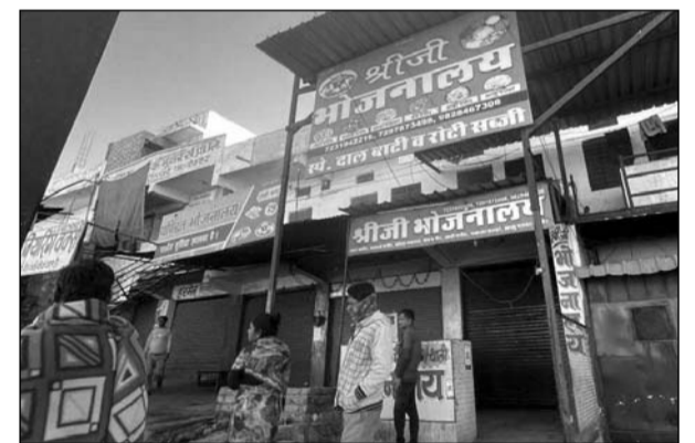
उदयपुर नगर निगम ने नगरीय विकास कर को लेकर कार्रवाई की।

उदयपुर, (का.सं.)। उदयपुर नगर निगम ने बुधवार सुबह नगरीय विकास कर को लेकर कार्रवाई करते हुए एक अपार्टमेंट को सीज किया। व्यवसायिक गतिविधियों वाली इस संपत्ति पर करीब नौ लाख रुपए का टैक्स बकाया था।