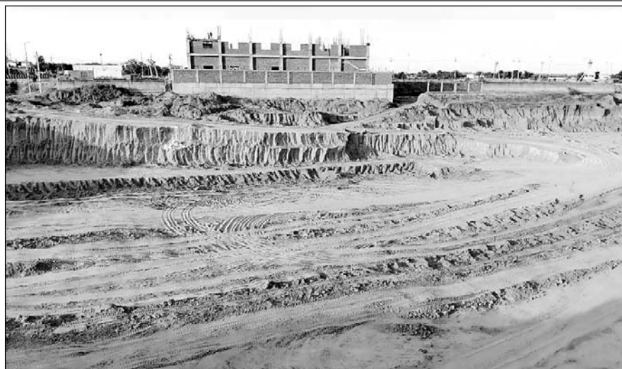
मिट्टी माफिया रीको के खाली पड़े प्लॉटों से लाखों की मिट्टी अवैध रूप से उठाकर बेच चुके हैं।

अब तक ये मिट्टी माफिया रीको के कई खाली पड़े प्लॉटों से लाखों रुपए की मिट्टी अवैध रूप से उठाकर बेच चुके हैं, लेकिन रीको विभाग अब तक इन भू माफियाओं के खिलाफ कोई कार्रवाई नहीं कर पाया है। यहां तक कि रीको के अधिकारी अपने प्लॉटों से मिट्टी उठाने से रोकने के लिए लिखित में भिवाड़ी थाने में शिकायत भी दे चुके हैं, लेकिन भिवाड़ी पुलिस ने रीको अधिकारी के द्वारा लिखित में शिकायत देने के बाद भी ना तो अभी मामला दर्ज किया है और ना ही इसमें मिट्टी माफियाओं के खिलाफ कोई कार्रवाई की है। आखिर में रीको आरएम ने इसकी शिकायत भिवाड़ी एसपी से की