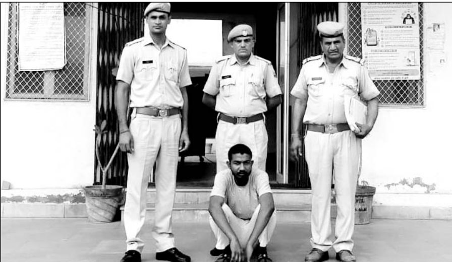
पचेरी कलां पुलिस ने बिजली के तार चोरी के मामले में एक आरोपी को गिरफ्तार किया।