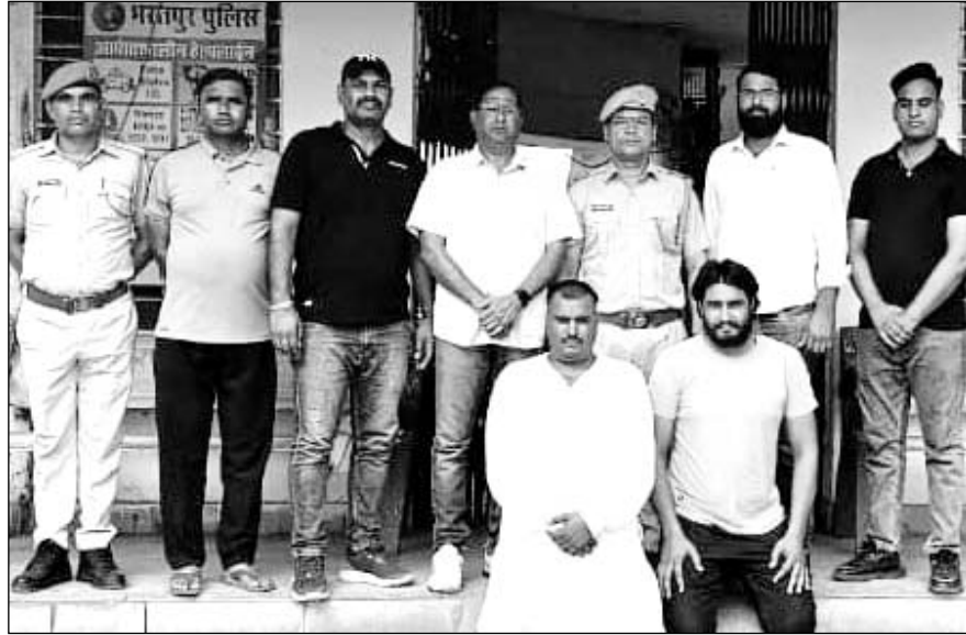
एंटी गैंगस्टर टास्क फोर्स पुलिस मुख्यालय की टीम ने दो आरोपियों को पकड़ा।