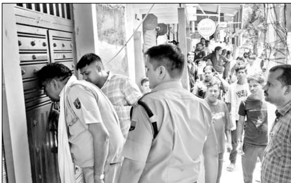
कोतवाली थाना इलाके में एक गेस्ट हाउस पर पुलिस पहुंची।

भीलवाड़ा, (निर्स)। शहर के कोतवाली थाना इलाके में एक गेस्ट हाउस पर संदिग्ध गतिविधियों की आशंका के चलते युवाओं की भीड़ ने हंगामा खड़ा कर दिया। सूचना पर पहुंची पुलिस गेस्ट हाउस से युवक-युवती को पूछताछ के लिए थाने ले गई।