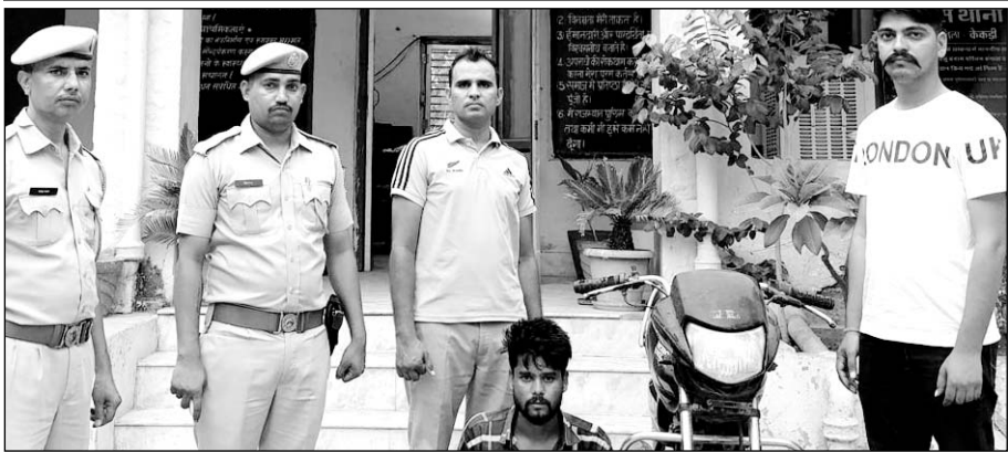
पुलिस टीम ने फरार आरोपी को गिरफ्तार किया।

पुलिस ने आरोपी के पास अवैध देशी कट्टा एवं चोरी की बाइक भी बरामद की