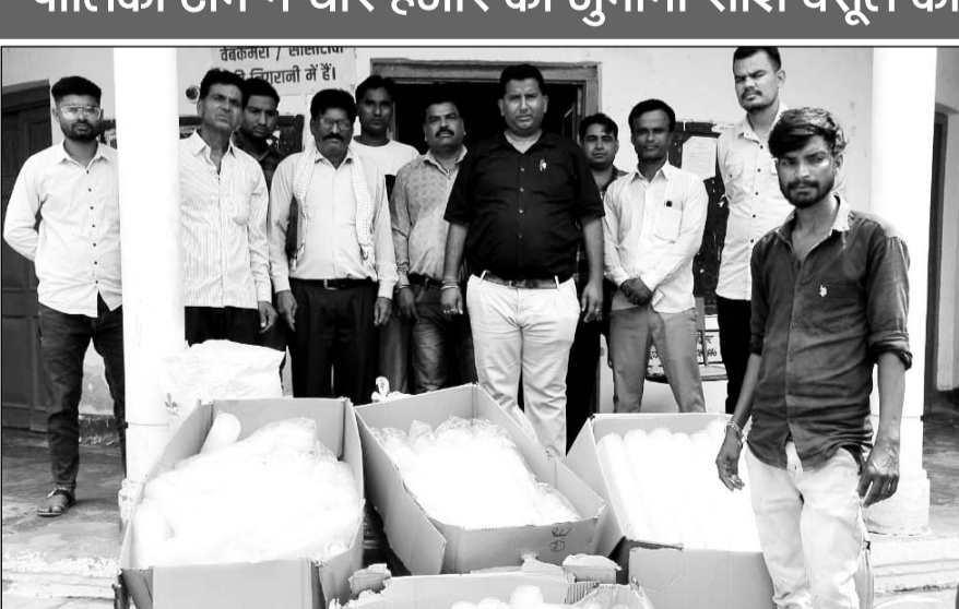
बीदासर पालिका टीम ने प्रतिबंधित सिंगल यूज प्लास्टिक के खिलाफ छापेमारी की।

बीदासर, (निर्स)। नगर पालिका की गठित टीम ने बुधवार को प्रतिबंधित सिंगल यूज प्लास्टिक के खिलाफ छापेमारी करते हुए करबे के मुख्य बाजार से एक क्विंटल पांच किलो पॉलीथिन व डिस्पोजल जर्ब कर चार हजार रुपये की जुरमना राशि वसूल की। पालिका की टीम के ज्योंही बाजार में पहुंचने की सूचना मिली तो व्यापारियों में हड़कंप मंच गया। छापेमारी के डर से कई दुकानदारों ने अपनी दुकानों के शटर गिराकर भाग गए।