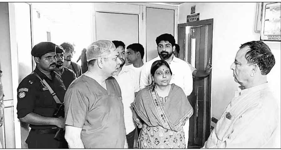
भाजपा हरियाणा प्रभारी एवं भाजपा राजस्थान पूर्व प्रदेश अध्यक्ष डॉ. सतीश पूनिया का मंगलवार देर रात को रोहतक (हरियाणा) में अपेंडिक्स का सफल ऑपरेशन हुआ।

■ भाजपा केंद्रीय नेतृत्व से लेकर हरियाणा एवं राजस्थान प्रदेश नेतृत्व ने सतीश पूनिया के शीघ्र स्वस्थ होने की कामना की