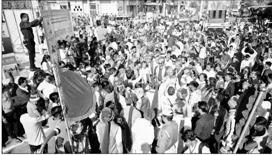
जालोर महोत्सव को लेकर शोभायात्रा निकाली गई।

स्टेडियम ग्राउंड पर जालोर महोत्सव 2023 का उदघाटन समारोह आयोजित हुआ। उदघाटन समारोह में