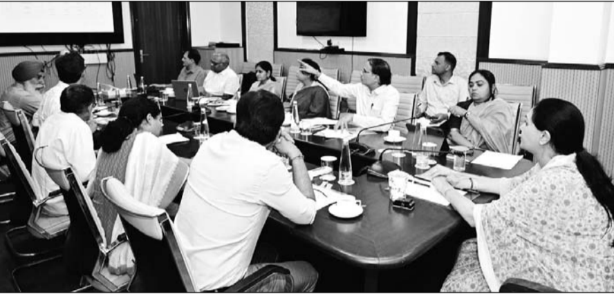
उपमुख्यमंत्री तथा महिला एवं बाल विकास मंत्री दिया कुमारी की अध्यक्षता में मंगलवार को सचिवालय में विभागीय योजनाओं एवं कार्यक्रमों की समीक्षा बैठक हुई।