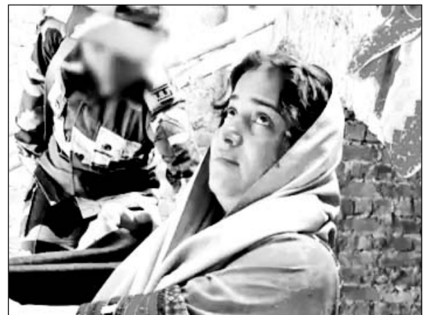
बीएसएफ ने भारत-पाक बॉर्डर पर घुसपैठ कर रही महिला को पकड़ा।