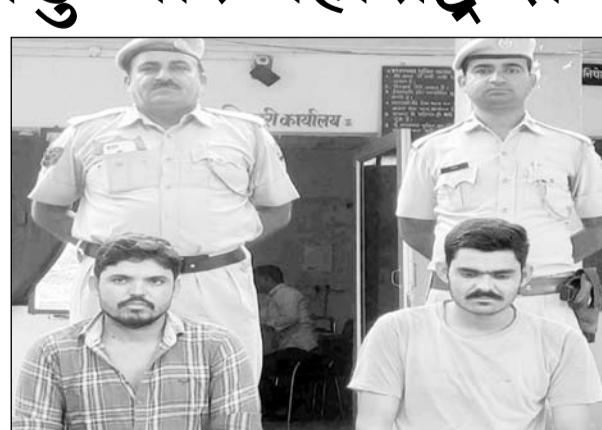
पुलिस की गिरफ्त में दुष्कर्म के आरोपी।