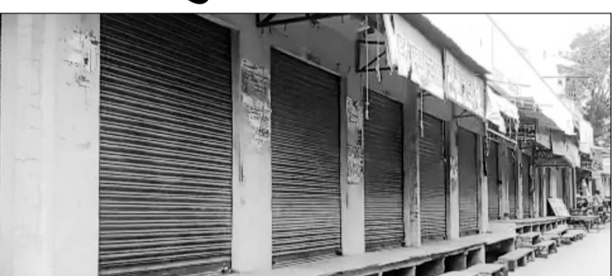
मांडल थाना क्षेत्र में तनाव की स्थिति के दौरान बाजार बंद रहे।

भीलवाड़ा, (निसं)। मांडल थाना क्षेत्र में भगवान की सवारी के दौरान डीजे साउंड बंद करने को लेकर दो समुदायों में विवाद हो गया और दोनों समुदाय के लोग आमने-सामने हो गए, जिससे तनाव की स्थिति बन गई। पुलिस ने कानून व्यवस्था कायम रखने के लिए अतिरिक्त सुरक्षा बल तैनात किया गया है।