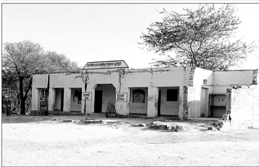
बृजपुरा के राजकीय उच्च प्राथमिक विद्यालय में बालक-बालिकाएं खुले में पढ़ने को मजबूर हैं।

बरसों गुजर जाने के बावजूद नहीं सुधर पाए हालात