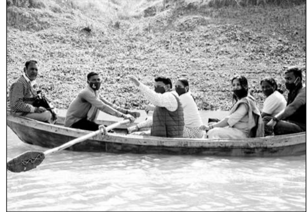
जान बचानी है तो जान जोखिम में भी डालेंगे...। नाव में बैठकर लोगों के टीकाकरण के लिए गंतव्य तक पहुंचती चिकित्सा विभाग एवं सेव द चिल्डन की टीम।

बांसवाड़ा, (निर्स)। छोटी सरवन ब्लॉक के दूरस्थ एवं आवागमन साधनों से रहित स्थानों पर वैक्सिनेशन टीम ने पहुंचकर लोगों का टीकाकरण किया। चिकित्सा एवं स्वास्थ्य विभाग तथा सेव द चिल्डन संगठन की ओर से शत प्रतिशत टीकाकरण के लिए नयास किये जा रहे हैं जिसके तहत विभाग एवं संगठन की टीम नाव के सहारे कोरोना महामारी से बचाव के लिए लोगों को टीका लगाने के लिए दूरस्थ टापुओं में पहुंची।