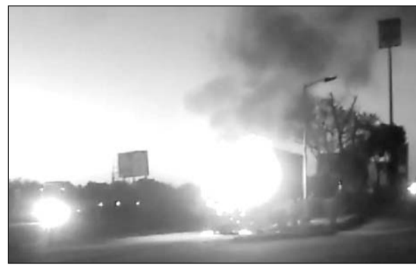
दिल्ली-अजमेर हाइवे पर बिलौची के पास कंटेनर में आग लग गई।