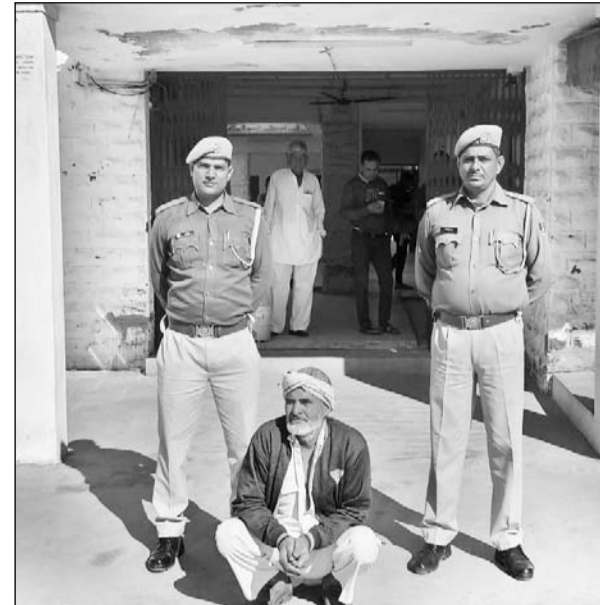
डीडवाना पुलिस ने फरार चल रहे बुजुर्ग आरोपी को गिरफ्तार किया।