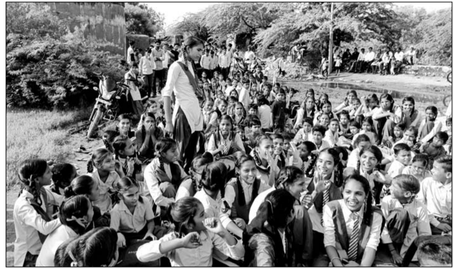
छात्राओं ने अध्यापकों की कमी को लेकर प्रदर्शन किया।

अध्यापकों की कमी के कारण पढ़ाई नहीं होने से ग्रामीण व अभिभावक भड़क गये