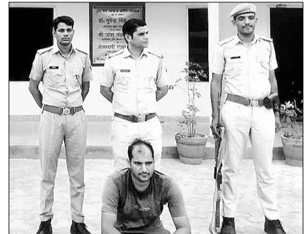
पुलिस ने अवैध शराब सहित आरोपी को गिरफ्तार किया।