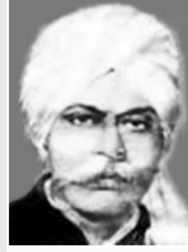
आचार्य किशोरी दास वाजपेयी