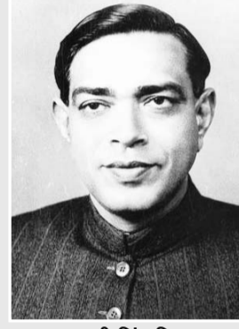
रामधारी सिंह दिनकर