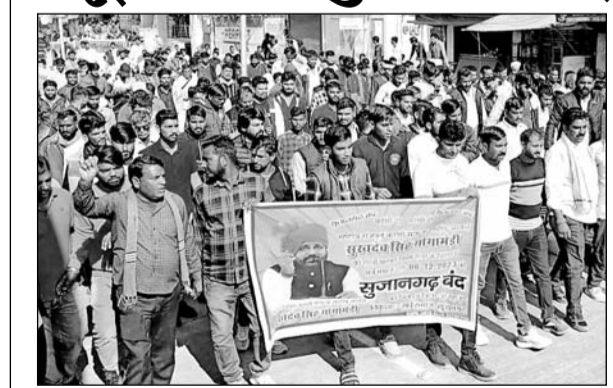
सुजानगढ़ में राजपूत समाज के लोगों ने विरोध रैली निकाली।