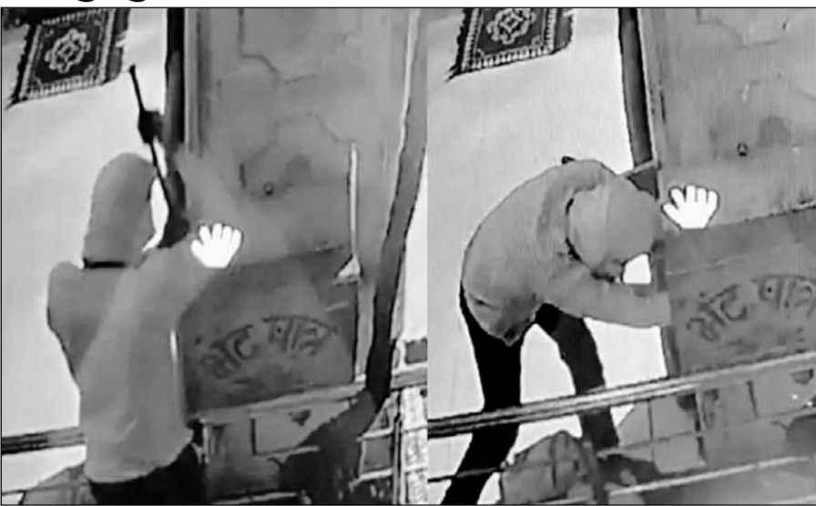
जिला मुख्यालय पर फलसे वाले बालाजी मंदिर में दान पात्र को तोड़ते सीसीटीवी कैमरे में कैद हुए चोर।

दोसा, (निर्स)। जिला मुख्यालय स्थित पीजी कॉलेज के पीछे फाल्स वाले बालाजी के प्राचीन मंदिर से चोर बीती रात को चांदी के मुकुट एवं छत्र सहित वहां रखे दान पात्रों से नगदी चोरी कर ले गये। चोरी की पूरी वारदात वहां लगे सीसीटीवी कैमरे में कैद हुई है। घटना का पता जब लगा जब सुबह पुजारी मंदिर की पूजा करने पहुंचा तो वहां के गेट खुले मिले व दान पात्र आदि सब टूटे हुए थे एवं मूर्ति से चांदी के छत्र मुकुट आदि भी गायब थे। मंदिर के पुजारी ने बताया कि वह मंगलवार रात्रि