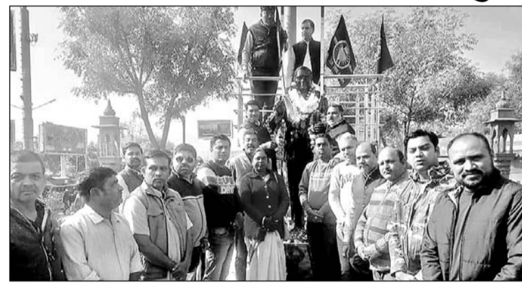
अजमेर में डॉ. बाबा साहेब अंबेडकर की प्रतिमा पर विभिन्न संगठनों के पदाधिकारियों व कई समाज के लोगों ने पुष्पांजलि अर्पित की।