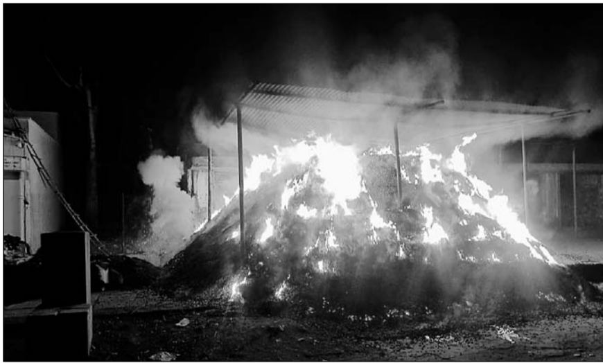
श्रीमधोपुर में कृषि उपज मंडी परिसर में दुकानों के बाहर रखे माल में अचानक आग लग गई।

तथा पुलिस प्रशासन को सूचना दी। आग लगने की सूचना के बाद मौके पर श्रीमधोपुर तथा रींगस की फायर ब्रिगेड पहुंची। सुबह तक आग बुझाने का प्रयास किया जा रहा था। अल सुबह 3 बजे से लगी आग को सुबह 5 बजे जाकर करीब 2 घंटे में काबू पाया। लेकिन फिर भी हल्की-हल्की आग की लपटें उठ रही थी। आग लगने के कारणों का अभी पता नहीं