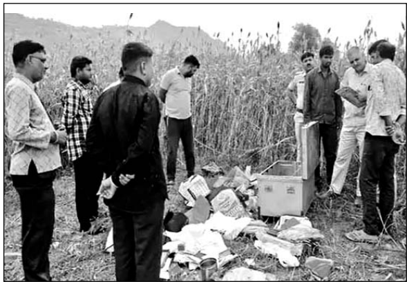
पुलिस ने खेत में पड़े बक्से की जानकारी ली।