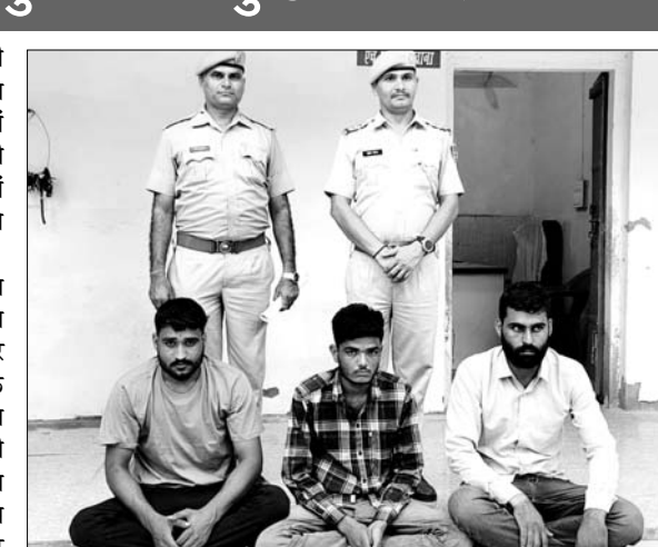
पुलिस ने हनीट्रेप मामले में तीन आरोपियों को गिरफ्तार किया।