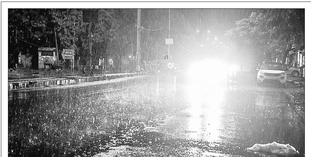
मंगलवार को चन्द्रग्रहण के तुरंत बाद ही राजधानी जयपुर में तीव्र हवाओं के साथ बारिश होने लगी जो देर रात तक रूक-रूक कर चलती रही। इससे शहर में सर्दी बढ़ने से लोग गर्म कपड़े पहने नजर आये।