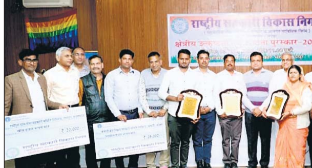
जयपुर के सहकार भवन में उत्कृष्ट काम करने वाली सहकारी समितियों को सम्मानित किया गया।