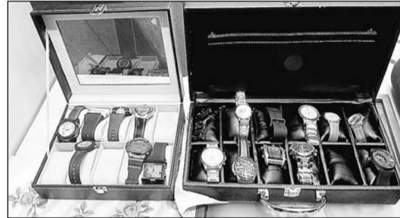
तलाशी के दौरान मिली सोने की घड़ियां व अन्य आईटम्स।