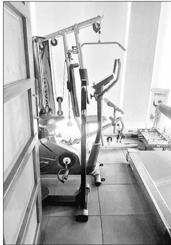
जयपुर स्थित जिम।