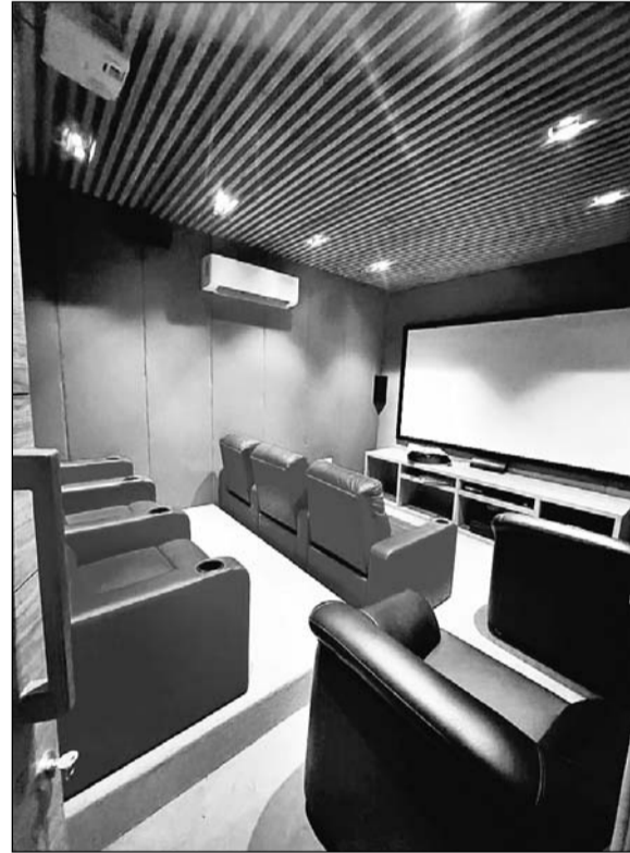
घर में बनाया हुआ आलीशान मिनी थियेटर।