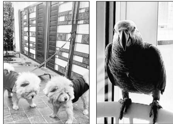
विदेशी नस्ल के कुत्ते और तोते घर में पाल रखे हैं।