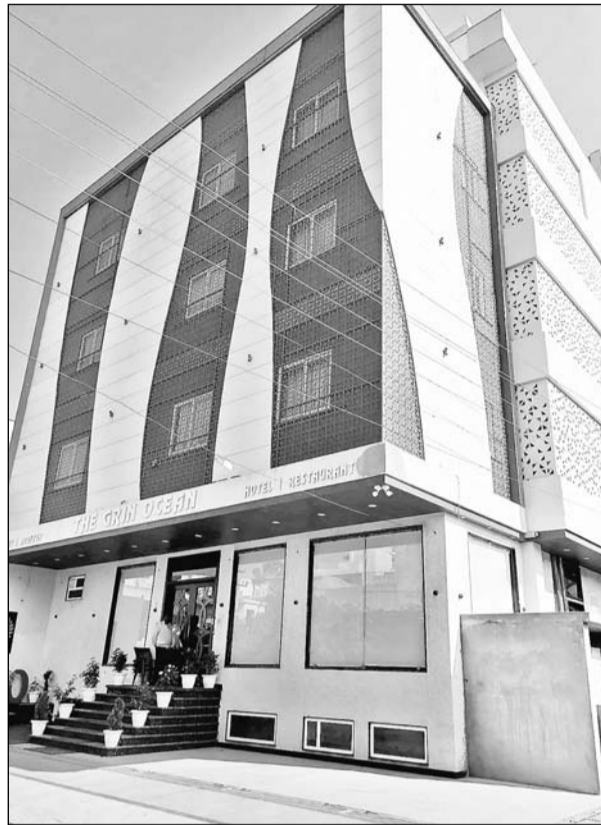
जयपुर स्थित होटल।