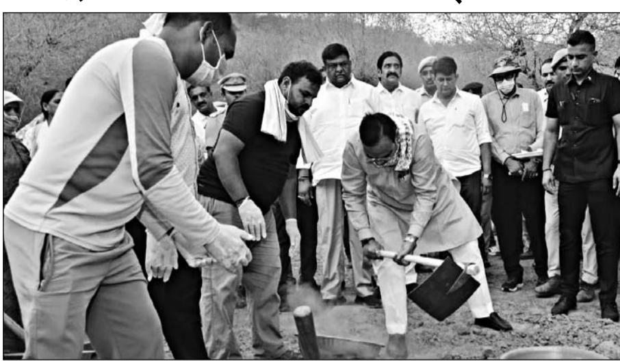
मुख्यमंत्री भजनलाल शर्मा ने शुक्रवार को नींदड वन क्षेत्र में बंदे गंगा जल संरक्षण-जन अभियान के तहत एनिकट पर श्रमदान किया।

जयपुर (कांस)। मुख्यमंत्री भजनलाल शर्मा ने शुक्रवार को नींदड वन क्षेत्र में नींदड-बैनाड बायोडाइवर्सिटी प्रोजेक्ट ईको ट्रेल का उद्घाटन किया। इस अवसर पर उन्होंने बंदे गंगा जल संरक्षण-जन अभियान के तहत एनिकट पर श्रमदान कर आमजन से जल संरचनाओं के संरक्षण एवं संवर्धन में सहभागिता निभाने का आह्वाण किया।