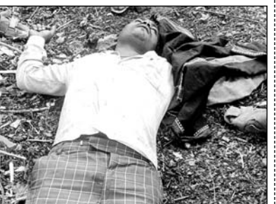
बून्दी जिले के पटपड़िया के नजदीक भुजर घाटे पर आकाशीय बिजली गिरने से तीन व्यक्तियों की मौत हो गई।

बून्दी, (निसं)। बून्दी जिले के डाबी थाना क्षेत्र के पटपड़िया के नजदीक भुजर घाटे पर आकाशीय बिजली गिरने से तीन व्यक्तियों की मौत हो गई। वहीं चार व्यक्ति गंभीर रूप से घायल हो गए। मौके पर पहुंची डाबी थाना पुलिस ने तीनों मृतकों को डाबी सीएसबी पहुंचाया। जहां मृतकों के शवों का पोस्टमार्टम किया गया।