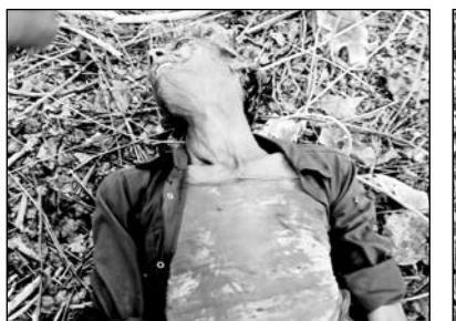
बून्दी जिले के पटपड़िया के नजदीक भुजर घाटे पर आकाशीय बिजली गिरने से तीन व्यक्तियों की मौत हो गई।