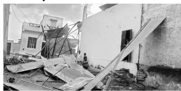
चाकसू में तेज अंधड़ और बारिश से कई जगह पर टीनशेड उड़ गये।

बिजली के पोल व तार टूट गए जिससे पूरे कस्बे में बिजली बंद हो गयी अंधड़ की रफ्तार इतनी तेज थी किसी को सम्भलने का ही मौका नहीं मिल सका। अंधड़ के बाद बादलों की तेज गर्जना के साथ जोरदार बारिश हुई सड़कों पर पानी ही पानी हो गया। छोटे-मोटे गड्ढे पानी से लबाबल हो गए। हालांकि इस दौरान हुई वर्षा से लोगों को गर्मी से राहत मिल गई और मौसम