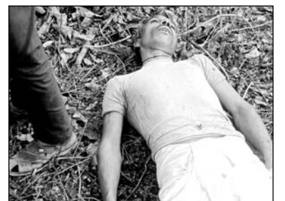
बून्दी जिले के पटपड़िया के नजदीक भुजर घाटे पर आकाशीय बिजली गिरने से तीन व्यक्तियों की मौत हो गई।