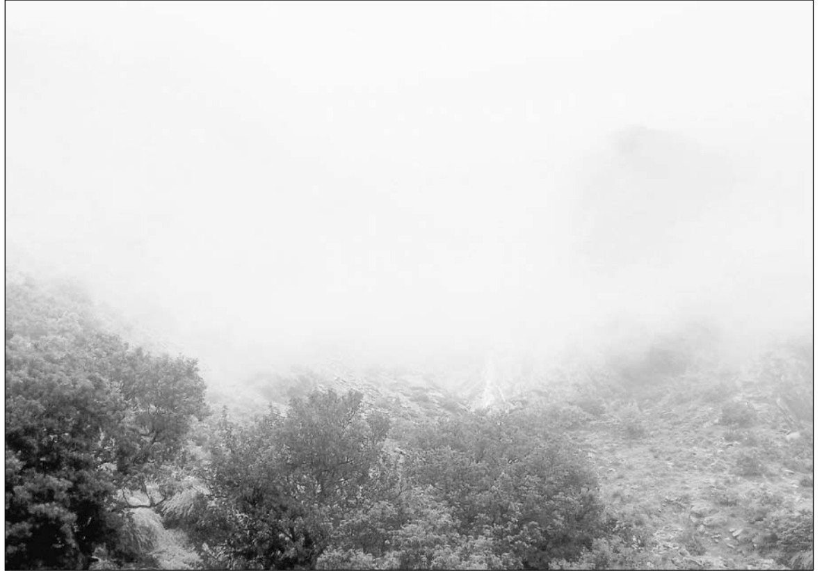
राजस्थान में मानसून को मेघ मल्हार चरम पर हैं। बारिश के बाद अरावली की पहाड़ियों से झरने बहने लगे हैं। सावन के इस हरियाली भरे मौसम में पहाड़ियों ने भी हरियाली की चादर ओढ़ ली। बारिश के बाद आसमान में धुंध छाये रहने से ऐसा लगने लगा है, जैसे बादल जमीं पर उतर रहे हों। जयपुर के नजदीक सामोद की पहाड़ियों का ये दृश्य ऐसा लगता है कि जैसे कुल्लू-मनाली की पहाड़ियां हों।