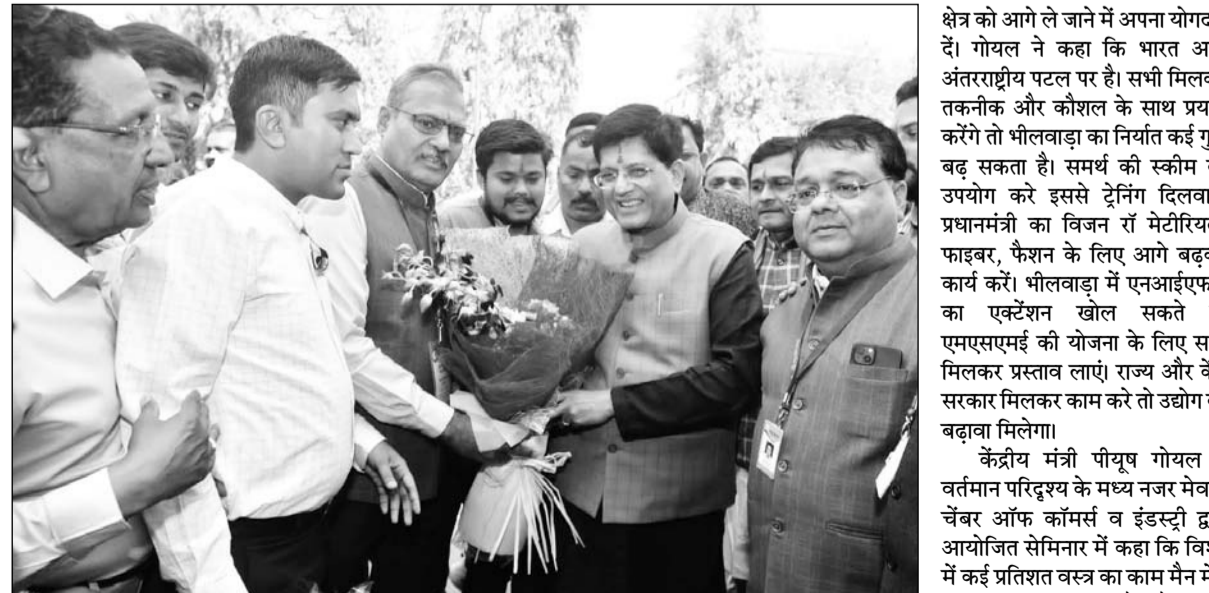
केंद्रीय वाणिज्य एवं उद्योग मंत्री पीयूष गोयल का भीलवाड़ा पहुंचने पर स्वागत किया।

इस अवसर पर गोयल ने भारतीय अर्थव्यवस्था एवं निर्यात में एमएसएमई एवं टेक्सटाइल सेक्टर के लिए नवीन अवसर पर आयोजित कार्यक्रम में कहा कि टेक्सटाइल इंडस्ट्री को आगे बढ़ाने के लिए आत्मनिर्भरता और कौशल पर अधिक बल देना होगा। वस्त्र उद्योग को बढ़ावा देने के लिए भी प्रधानमंत्री सहयोग कर रहे हैं। गोयल ने कहा प्रधानमंत्री ने देश को समृद्ध करने और देश को अग्रणी ले जाने में महत्वपूर्ण योगदान दिया। गोयल ने कहा कि देश को आत्मनिर्भर बनाना है और आत्मनिर्भर शक्ति के रूप में महत्वपूर्ण