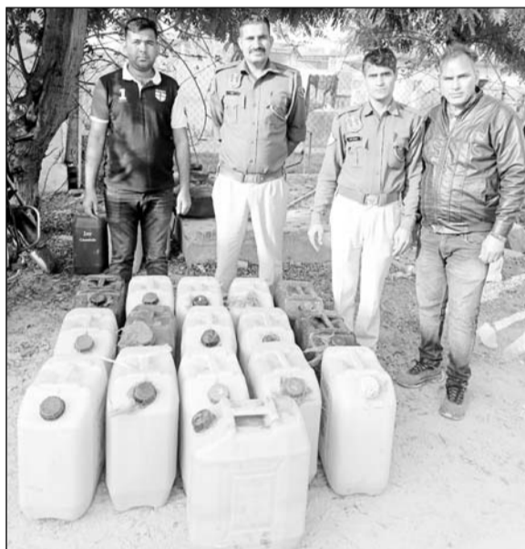
पुलिस ने अवैध हथकढ़ शराब के खिलाफ बड़ी कार्रवाई की।

चाकसू, (निस)। उपखंड क्षेत्र के शिवदासपुरा थाना अंतर्गत पुलिस ने अवैध हथकढ़ शराब रोकथाम को लेकर एक बड़ी कार्रवाई करते हुए दो अलग-अलग स्थानों से 560 लीटर हथकढ़ शराब जप्त करते हुए करीब 12000 लीटर वांश को नष्ट किया और अवैध शराब बनाने के काम की जाने वाली सामग्री को जप्त किया है। इसके साथ ही कार्रवाई की भनक लगते ही आरोपी फरार हो गया जिसकी पुलिस को तलाश जारी है।