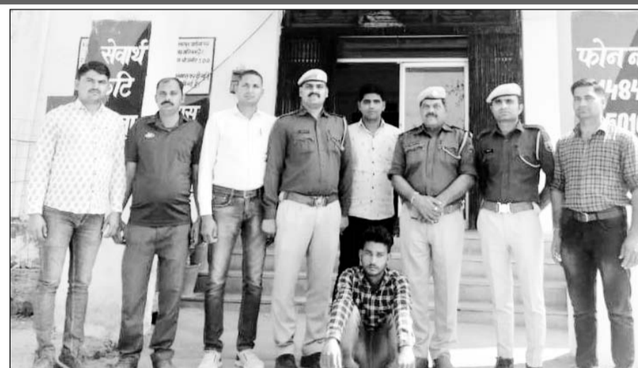
फुलिया कला पुलिस ने वृद्धा की हत्या के मामले में आरोपी को गिरफ्तार किया।