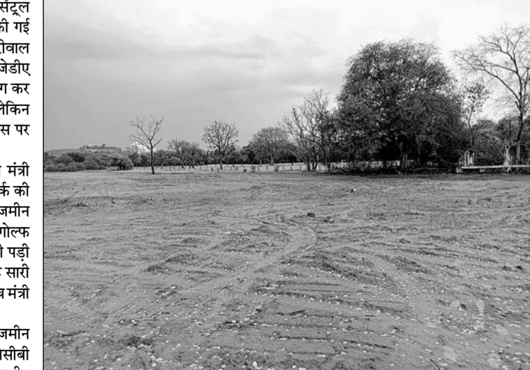
सेंट्रल पार्क की जमीन पर हरे-भरे पेड़ काटने के बाद समतल की गई जमीन।

जयपुर (कासं)। जयपुर का हृदयस्थल सेंट्रल पार्क में सैकड़ों पेड़ काटकर समतल की गई जमीन का नगरीय विकास मंत्री शांति धारीवाल ने शुक्रवार को निरीक्षण किया। उन्होंने जेडीए के अधिकारियों को इस जमीन पर फेंसिंग कर वापस पेड़ लगाने के आदेश तो दिए, लेकिन जिस किसी ने भी इन पेड़ों को काटा, उस पर कार्रवाई के लिए कुछ नहीं बोले।