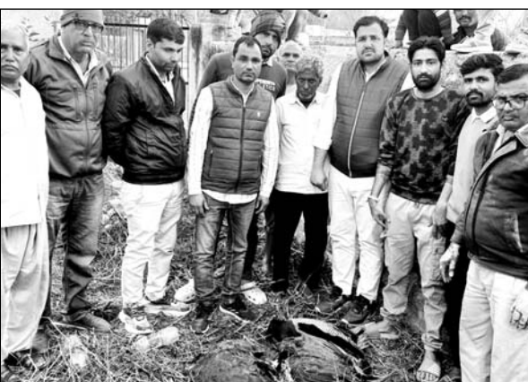
मृत मोर मिलने पर लोगों ने आक्रोश जताया।