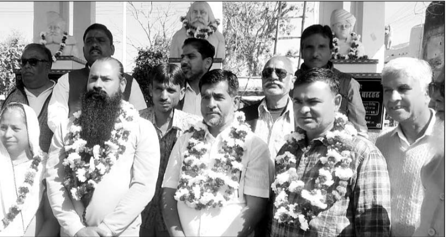
पांच पार्षदों ने शाहपुरा जिला को समाप्त करने के विरोध में त्यागपत्र दिया।