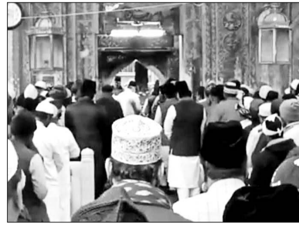
ख्वाजा मोइनुद्दीन हसन चिश्ती की महाना छठी पर दरगाह में उमड़ी जायरीन की भीड़।

हाजरी देकर अमन-चैन और भाईचारे की भी दुआएं मांगीं। सरवाड़ में चल रहे ख्वाजा फखरुद्दीन के सालाना उर्स में जायरीन ने शिरकत की।