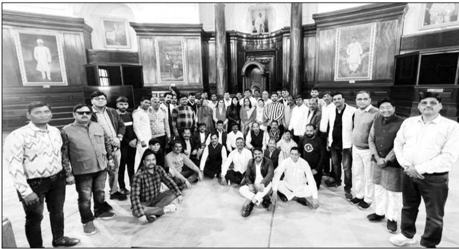
ऊर्जा मंत्री हीरालाल नागर की पहल पर भाजपा कार्यकर्ता संसद का भ्रमण करने पहुंचे।

कोटा, (निसं)। ऊर्जा मंत्री हीरालाल नागर की पहल पर सांगोद विधानसभा क्षेत्र के कार्यकर्ताओं का दिल्ली दर्शन कार्यक्रम संपन्न हो गया। उल्लेखनीय है कि संगठन पर्व के दौरान जिन कार्यकर्ताओं ने 100 से अधिक सदस्य बनाए उन सभी कार्यकर्ताओं को ऊर्जा मंत्री नागर की ओर से दिल्ली का भ्रमण कराने की घोषणा की गई थी। जिसके तहत क्षेत्र के सांगोद नगर मंडल, देहात, कनवास, देवली, दीगोट, सीमलिया, बक्वर मण्डल के तकरीबन 350 कार्यकर्ता बसों से विभिन्न अलग-अलग दिनों में दिल्ली आये थे। इन्हें लोकसभा स्पीकर ओम बिरला तथा मंत्री नागर के सौजन्य से संसद भ्रमण कराया गया। उन्होंने संसद सत्र के दौरान संसद की कार्यप्रणाली भी देखी। साथ ही, इंडिया गेट, राष्ट्रपति भवन, प्रधानमंत्री संग्रहालय,