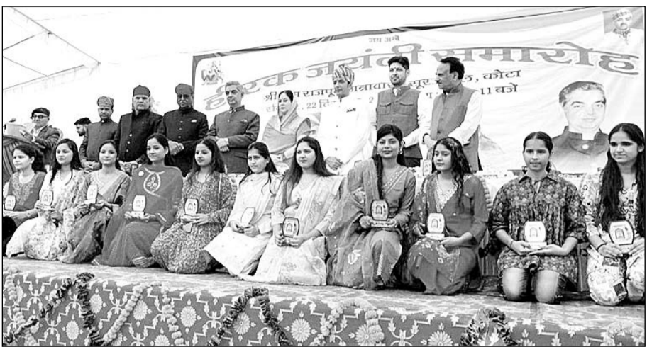
कोटा में भीम राजपूत छात्रावास का हीरक जयंती समारोहपूर्वक आयोजित हुआ।