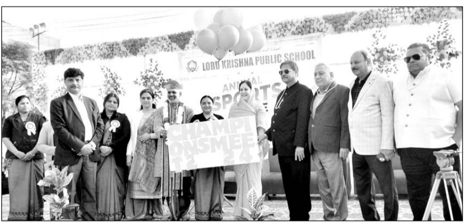
लार्ड कृष्णा पब्लिक स्कूल के स्पोर्ट्स-डे का शुभारंभ हुआ।

स्पोर्ट्स डे समारोह में बच्चों ने गणेश वंदना की मनमोहक प्रस्तुति दी। स्पोर्ट्स डे के वाषिर्क समारोह में स्कूल के छोटे-छोटे बच्चों ने 'जिंगल वेल जिंगल बेल' और फिल्मों गीतों, साउथ इंडियन, राजस्थानी गानों पर एक से बढ़कर एक प्रस्तुति दी। वाषिर्क समारोह में एनसीसी केडेट द्वारा मार्च परेड निकाली गई, अतिथि द्वारा मार्च परेड को सलामी दी गई। स्कूली बच्चों ने इस मौके पर सूर्य नमस्कार की प्रस्तुति दी। इस अवसर पर खेलों में प्रथम द्वितीय