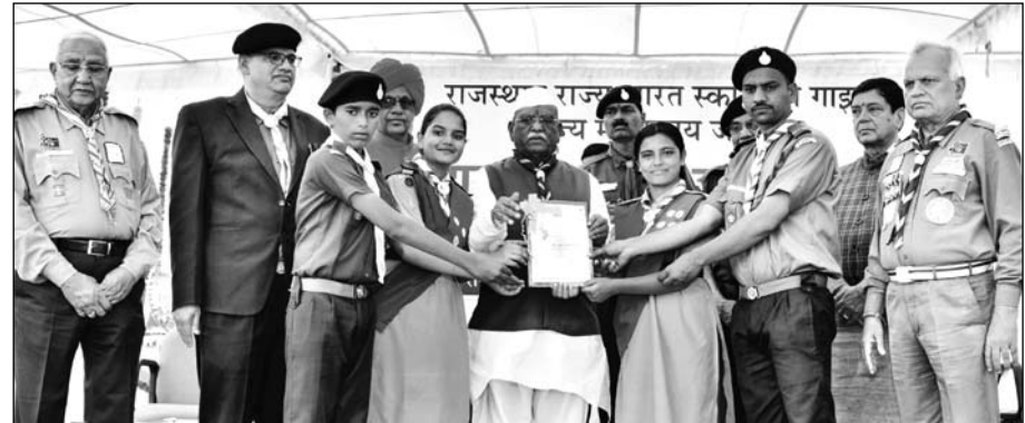
राज्यपाल हरिभाऊ बागडे ने स्काउट-गाइड के उत्कृष्ट प्रदर्शन वाली जिला इकाइयों को राज्य स्तरीय पुरस्कार प्रदान किए।

जयपुर। राज्यपाल हरिभाऊ बागडे ने कहा कि स्काउट गाइड संगठन नहीं, आदर्श कार्य संस्कृति है। उन्होंने कहा कि इस संगठन के जरिए प्रयास किया जाए कि नवयुवकों की बौद्धिक क्षमता बढ़े। इसी से भारत सभी क्षेत्रों में तेजी से विकास की ओर अग्रसर हो सकेगा। राज्यपाल शनिवार को राजस्थान राज्य भारत स्काउट गाइड राज्य