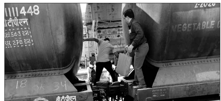
फुलेरा जंक्शन पर रेलयात्री जान जोखिम में डालकर रेलवे स्टेशन पहुंच रहे हैं।

परेशानियों का सामना करना पड़ेगा। प्रशासन द्वारा रेलवे स्टेशन के अंतिम छोर में बनाया गया ओवरब्रिज भी काफी ऊंचा होने के कारण बुजुर्गों को यहां से आने-जाने में काफी दिक्कतों का सामना करना पड़ता है। इसके चलते यहां एस्केलेटर या लिफ्ट लगे तो जरूर इनको राहत मिल सकती है लेकिन अभी वर्तमान में स्थिति काफी दयनीय है। जबकि फुलेरा से प्रतिदिन 15 हजार से अधिक दैनिक रेलयात्री अपनी रोजी रोटी कमाने के लिए जयपुर एवं अजमेर सहित अन्य स्थानों के लिए अप-डाउन करते हैं। कई बार तो ओवरब्रिज होकर जाते जाते इनकी ट्रेन भी छूट जाती है।