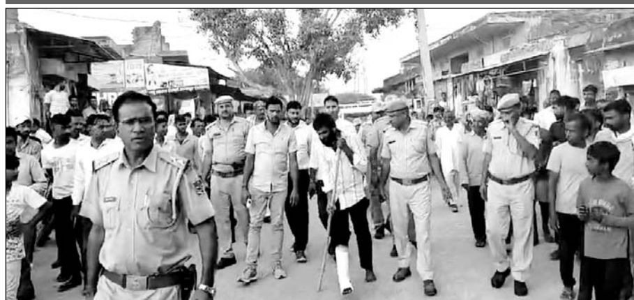
पाटन पुलिस ने पिस्तौल की नोक पर लूटपाट करने वाले अपराधियों को गिरफ्तार कर रायपुर-पाटन गांव में जुलूस निकाला।

पुलिस दोनों आरोपियों को रायपुर-पाटन गांव में ले जाकर जुलूस निकाला