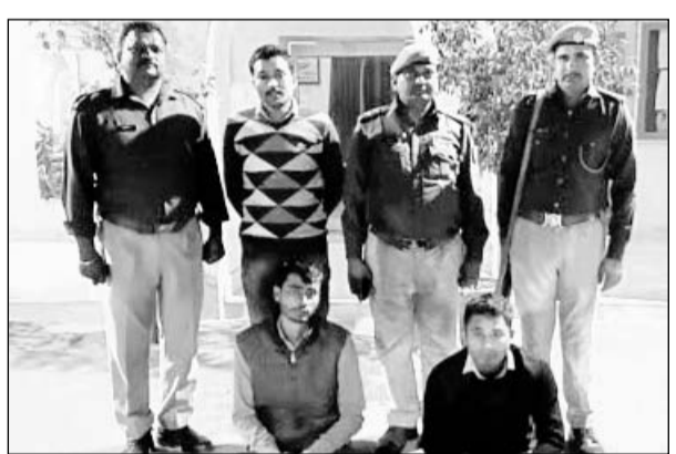
पुलिस ने आरोपियों को गिरफ्तार किया।