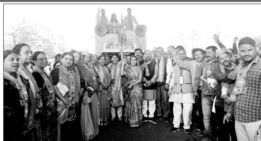
कोटा में जन आक्रोश रैली में भाजपा समर्थक महिलाओं ने बड़बूढ़ कर भाग लिया।