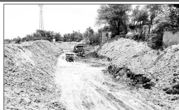
पानी निकासी को लेकर खाई में खुदाई करती जेसीबी मशीन।

नगर पालिका की ओर से चलाए गए जोहड़, खाई खुदाई के कार्य से जोहड़ और खाई की जमीन पर वर्षों से कब्जा किए हुए लोगों में हड़कंप मचा हुआ है। लोगों का कहना है कि तत्कालीन रहे सरपंचों ने अपनी अपनी राजनीति घेपकाने के लिए जोहड़ खाई की भूमि पर पट्टे जारी किए हुए हैं। किले के चारों ओर राजा महाराजाओं की ओर से पानी भराव के लिए बनाई गई खाई