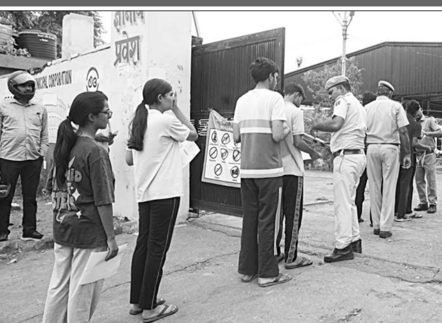
नीट परीक्षा देने पहुंचे अभ्यर्थियों को परीक्षा केंद्र में प्रवेश देने से पूर्व पुलिस ने उनकी गहनता से जांच की।

-कार्यालय संवाददाता- जयपुर। राष्ट्रीय पात्रता सह प्रवेश परीक्षा (नीट-यूजी) की पुनः परीक्षा रविवार को राजधानी जयपुर में कड़े सुरक्षा प्रबंधों और प्रशासनिक निगरानी के बीच शांतिपूर्ण एवं सुव्यवस्थित ढंग से संपन्न हुई। जयपुर जिले के 103 परीक्षा केंद्रों पर आयोजित परीक्षा में 37128 अभ्यर्थी पंजीकृत थे। जिनमें से 34031 अभ्यर्थी उपस्थित रहे, जबकि 3,097 अनुपस्थित रहे। इस प्रकार कुल उपस्थित 91.66 प्रतिशत दर्ज की गई। परीक्षा दोपहर 2 बजे शुरू होकर शाम 5:15 बजे समाप्त हुई। नेशनल टेस्टिंग एजेंसी (एनटीई) ने अभ्यर्थियों को 15 मिनट का अतिरिक्त समय दिया। परीक्षा समाप्त होने के बाद 22 गोदाम सिकल, परकोटा क्षेत्र के प्रमुख बाजारों तथा शहर के कई व्यस्त मार्गों पर परीक्षाार्थियों और उनके परिजनों की भीड़ उमड़ने से यातायात व्यवस्था प्रभावित नहीं और कई स्थानों पर वाहन रंगते नजर आए। परीक्षा की संवेदनशीलता को देखते हुए इस बार अभूतपूर्व सुरक्षा व्यवस्था की गई थी। अभ्यर्थियों को परीक्षा केंद्र में प्रवेश से पहले श्री-लेयर सिक्वोरिटी जांच से