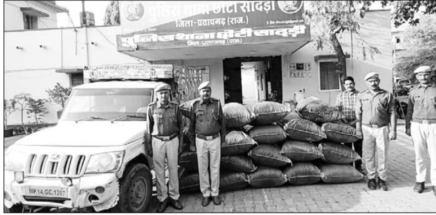
छोटी सादड़ी थाना पुलिस की टीम ने 325 किलो डोडा-चूरा जब्त किया।