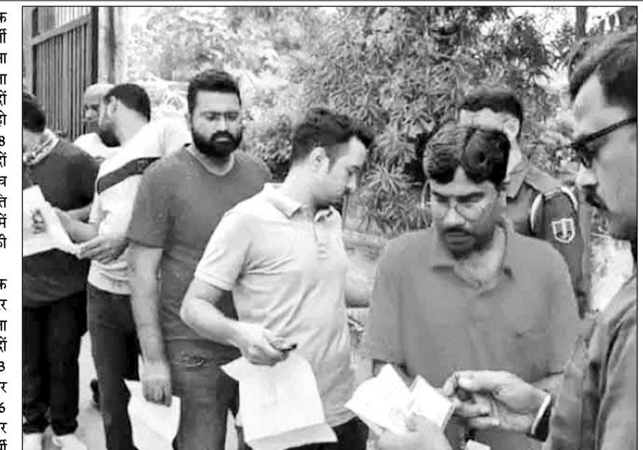
परीक्षा केंद्र पर जांच के बाद परीक्षा देने जाते अभ्यर्थी।