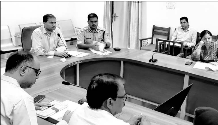
गंगानगर कलेक्टर लोकबन्धु ने जिला स्तरीय स्टेडिंग कमेटी और नार्को को-ऑर्डिनेशन सेंटर की बैठक को संबोधित किया।

मादक पदार्थों की तस्करी और अवैध आवागमन को रोकने के लिए इंटर स्टेट बॉर्डर पर प्रभावी निगरानी के निर्देश देते हुए जिला कलेक्टर ने कहा कि बीएसएफ के साथ-साथ पुलिस भी नियमित निगरानी करते हुए आवश्यक कार्रवाई करें। अंतर्राष्ट्रीय सीमा क्षेत्र में ड्रोन गतिविधियों पर नियंत्रण के लिए बीएसएफ, आर्मी, पुलिस सहित अन्य एजेंसी निगरानी बढ़ाएं। आमजन को नशा मुक्ति हेतु जागरूक करने के लिए जिले में संचालित ऑपरेशन सीमा का जिक्र करते हुए जिला कलेक्टर ने कहा कि पुलिस, स्वास्थ्य, औषधि नियंत्रक तथा सामाजिक न्याय एवं अधिकारिता विभाग की संयुक्त टीम की ओर से मेडिकल स्टोर्स, नशा मुक्ति केंद्रों और मनो चिकित्सा केंद्रों को औचक जांच की जाए। अनियमितता मिलने पर नियमानुसार कार्रवाई की जाये।